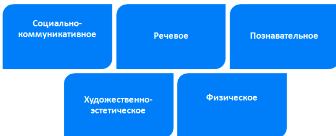
Рисунок 5. Пять направлений развития дошкольника

ФГОС ДО – это стандарт развития дошкольников. В отличие от школьных стандартов, ФГОС ДО не требует от сада оценивать подготовку и знания воспитанников. Никаких промежуточных или итоговых аттестаций детский сад не проводит. Цель работы по ФГОС ДО – подготовить ребенка к школе. Для этого его нужно развивать по пяти направлениям (рисунок 5).