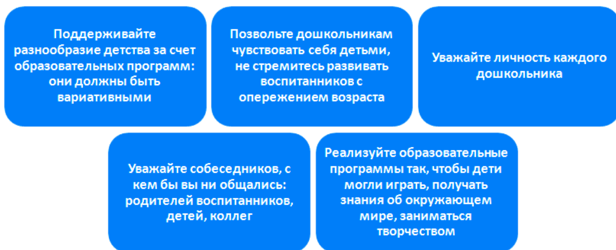
Рисунок 4. Принципы работы детского сада по ФГОС ДО

ФГОС ДО определяет пять принципов, по которым должны работать все детские сады. Что это за принципы, смотрите на рисунке 4.